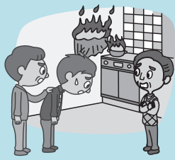
不小心导致了 公寓失火……

留学生本人因【日常生活中的事故】或【因留学之故而使用宿泊/居住设施时的事故】而导致他人受伤或他人财物受损，因此需要承担损害赔偿时，该保险将为其支付保险金。