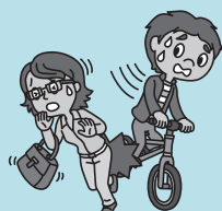
冲撞行人！ 意外撞伤了别人……