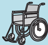
滑雪时撞到了树， 产生了后遗症……