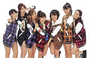
公式応援団 アップアップガールズ(仮)